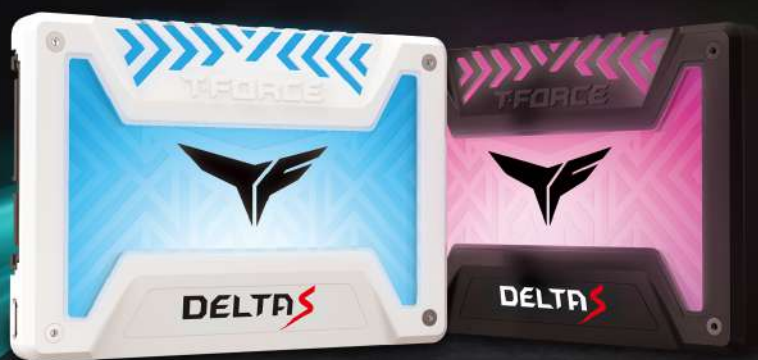
DELTA S RGB SSD(12V)